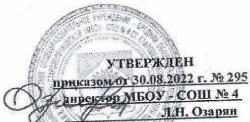
График оценочных процедур в МБОУ - СОШ № 4 ст. Старовеличковской на 2022-2023 учебный год